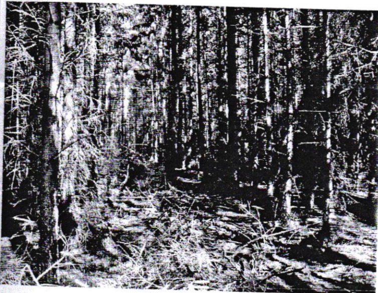
Fichtenbestand (AJ0) auf der Maßnahmenfläche ohne Krautschicht, ausschließlich Moose